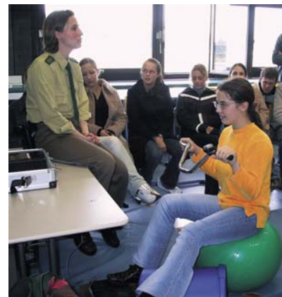
Im Rahmen der Verkehrserziehung bietet es sich beispielsweise an, externe Fachleute in den Physikunterricht einzubeziehen. Die Polizistin hat einen Fahr Simulator mitgebracht, an dem Bremsversuche durchgeführt werden.

Auch Eltern müssen Physik wertschätzen lernen. Dies lässt sich in Elternabenden thematisieren, man kann ein „Schnupperpraktikum“ für Eltern und Kinder organisieren oder einen gemeinsamen „naturwissenschaftlichen“ Ausflug. So organisiere ich zum Beispiel nach der Unterrichtseinheit Atomphysik in Klasse 10 eine Exkursion für die ganze Familie in den Atomkeller von Haigerloch. Treffpunkt ist am Samstagvormittag an der Schule, wo die Kinder ihre Eltern über Kernspaltung und Entwicklung und Wirkung der Atombombe informieren. Anschließend fahren wir nach Haigerloch, wo ich die Führung im Atomkeller übernehme. Die Organisation des Mittagessens und eine Besichtigung des Judenviertels von Haigerloch wird von den Eltern geleistet. Zusätzlich ist dies eine hervorragende Gelegenheit, um mit Eltern auch über naturwissenschaftliche Berufsfelder – insbesondere auch für ihre Töchter – ins Gespräch zu kommen.