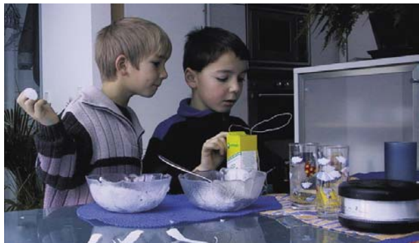
Experimente können auch im Rahmen von Hausaufgaben am Küchentisch durchgeführt werden. Die beiden Jungen mischen unterschiedlich warmes Wasser sowie Schnee und Salz und messen jeweils die Temperatur des Gemisches.