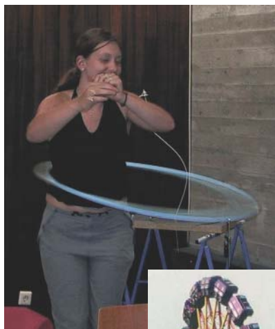
Beim eigenständigen Forschen untersucht diese Schülerin die Physik des Hula-Hoop-Reifens (oben). Starke Fliehkräfte lassen sich beim Besuch des Stuttgarter Volksfestes hautnah erleben (rechts).

Jede Gelegenheit, den Physiksaal zu verlassen, Physik auch mit dem Körper zu erleben, sollte ergriffen werden. So ist das Stuttgarter Volksfest und das Erleben von starken Fliehkräften eine Pflichtveranstaltung, Experimente zu actio und reactio, zu Rollreibung, zur Geschwindigkeit und Beschleunigung finden im Freien statt. Wer gewinnt beim Wettbeschleunigen auf dem